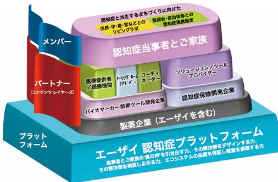
【図表1】「エーザイ認知症エコシステム」の概要

いうモデルのもと、認知症関連の課題解決に必要な全ての領域と業種を対象に、当社が持つ情報やデータを活用できるようにするプラットフォーム型のビジネスを推進しています(図表1)。エコシステムは、「メンバー」「パートナー」「プラットフォーム」という3つの要素で構成されます。認知症当事者とそのご家族が「メンバー」です。疾患啓発、早期診断、治療、介護、認知症情報の提供・相談といった領域で当社がこれまで蓄積してきた情報やデータを「プラットフォーム」として活用することで、「パートナー」は医薬品だけでなく認知症患者様の見守り支援ツールや認知症に特化した保険など、これまでの認知症関連の枠を超えたさまざまなソリューションを「メンバー」に提供することが可能となり